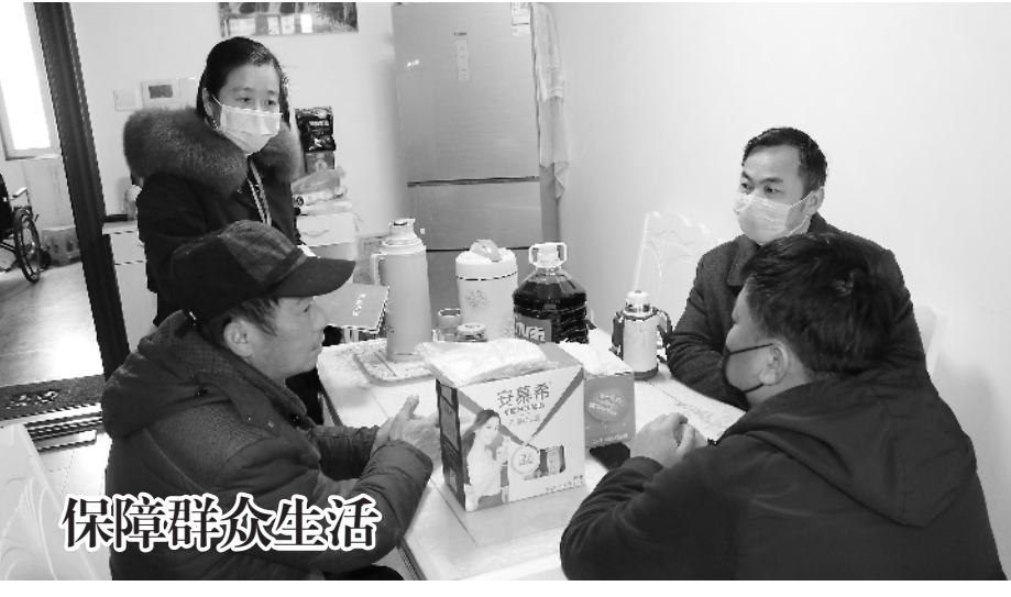
▲ 连日来,巢湖市凤凰山街道黎明社区坚持疫情防控与脱贫攻坚两手抓,并将口罩、药物、米油等物资送到困难群众家中,确保他们在防疫期间生活如常。图为工作人员到凤凰之家小区的一位贫困户家中慰问。