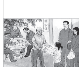
帮父母参加新农合新农保