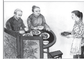
保障父母衣食无忧