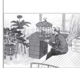
让父母居住安全舒适