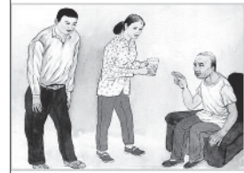
耐心倾听父母唠叨