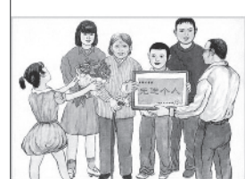
向父母多报喜少报忧