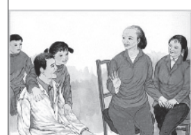
家事多听父母意见