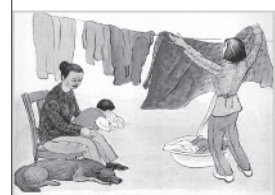
尽量与父母共同生活