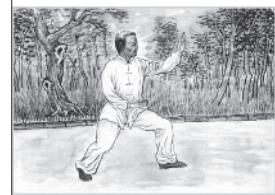
帮父母养成良好生活习惯